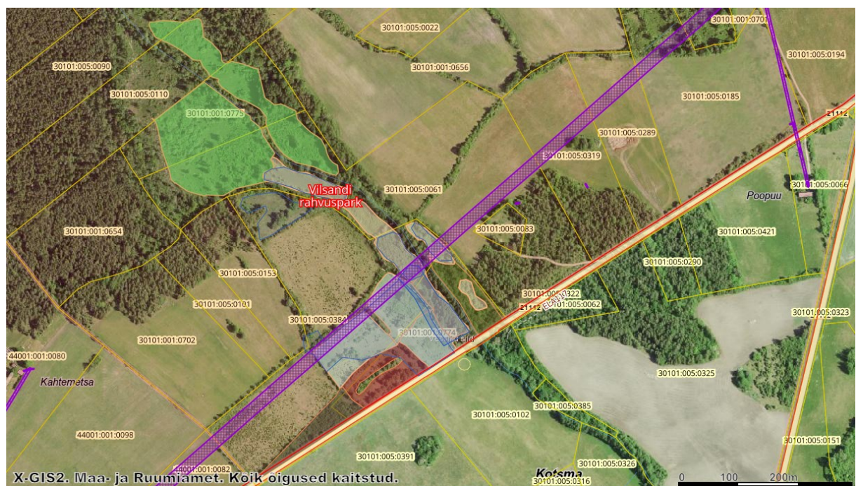
Joonis 2. III kaitsekategooria taimeliigid (sinine) ja kaitstav elupaigatüüp (oranž)