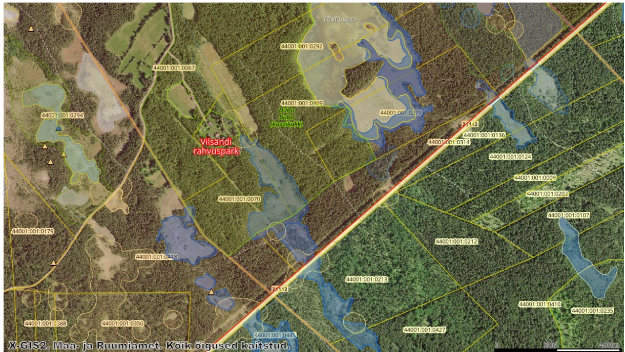
Joonis 3. Kassikaku elupaik (roheline), II kaitsekategooria taimeliik (kollane), III kaitsekategooria taimeliik (sinine)

Tööde alale jääb ka I kaitsekategooria linnuliigi kassikaku ( Bubo bubo ; KLO9126327) registreeritud elupaik. Keskkonnaameti andmetel on see kassikaku elupaik ammu asustamata.